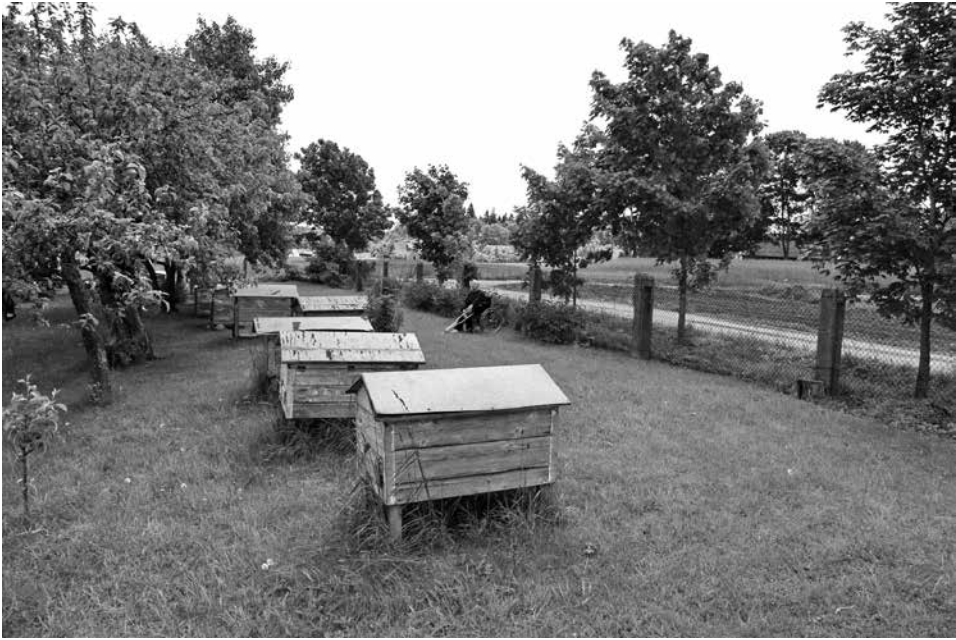
5. Janina šeimos bityno priešakyje. 2012 m. birželio 6 d.