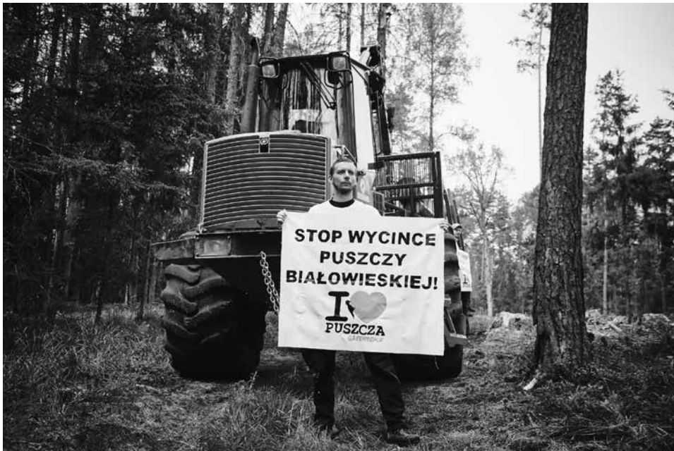
Ekologijos aktyvistas, protestuodamas prieš miško kirtimus, grandine prisirakino prie medžių kirtimo technikos Belovežo girioje. 2017.05.29