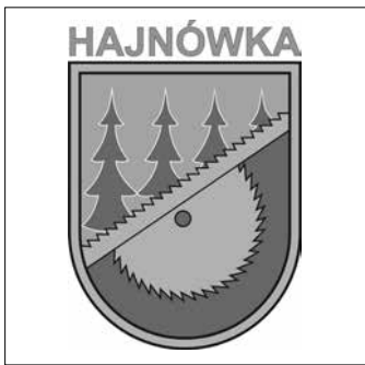
Hainuvkos miestelio herbas

Hainuvka iki XX a. buvo menkutis kaimas, sparčiai pradėjęs augti socialistinės Lenkijos laikais. Besiplėtojant medienos pramonei Hainuvkoje buvo pastatyta nemažai lentpjūvių ir daugiaaukščių blokinių namų, skirtų jose dirbantiems žmonėms apgyvendinti. 1951 metais Hainuvka gavo miesto teises. Šiais laikais miestelis išgyvena tapatybės krizę: tarpusavio kovos dėl girios kirtimų teisėtumo ir moralumo stumia jos gyventojus į naujos tapatybės paieškas. Pastaruoju metu net yra kilę debatų, ar nereikėtų miesteliui pasikeisti herbą, kuris šiuo metu vaizduoja medžius pjaunantį pjūklą (iš girios gidės pokalbio su autoriumi 2018.05.31).