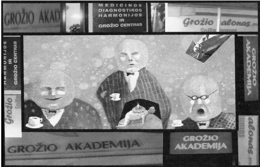
Krulėjanti (modernėjanti) Platono akademija

dymus-išnykimus? („Argi pati erotiškiausia kūno vieta nėra ten, kur drabužis prasiskiria“; Barth 1991; 276.)