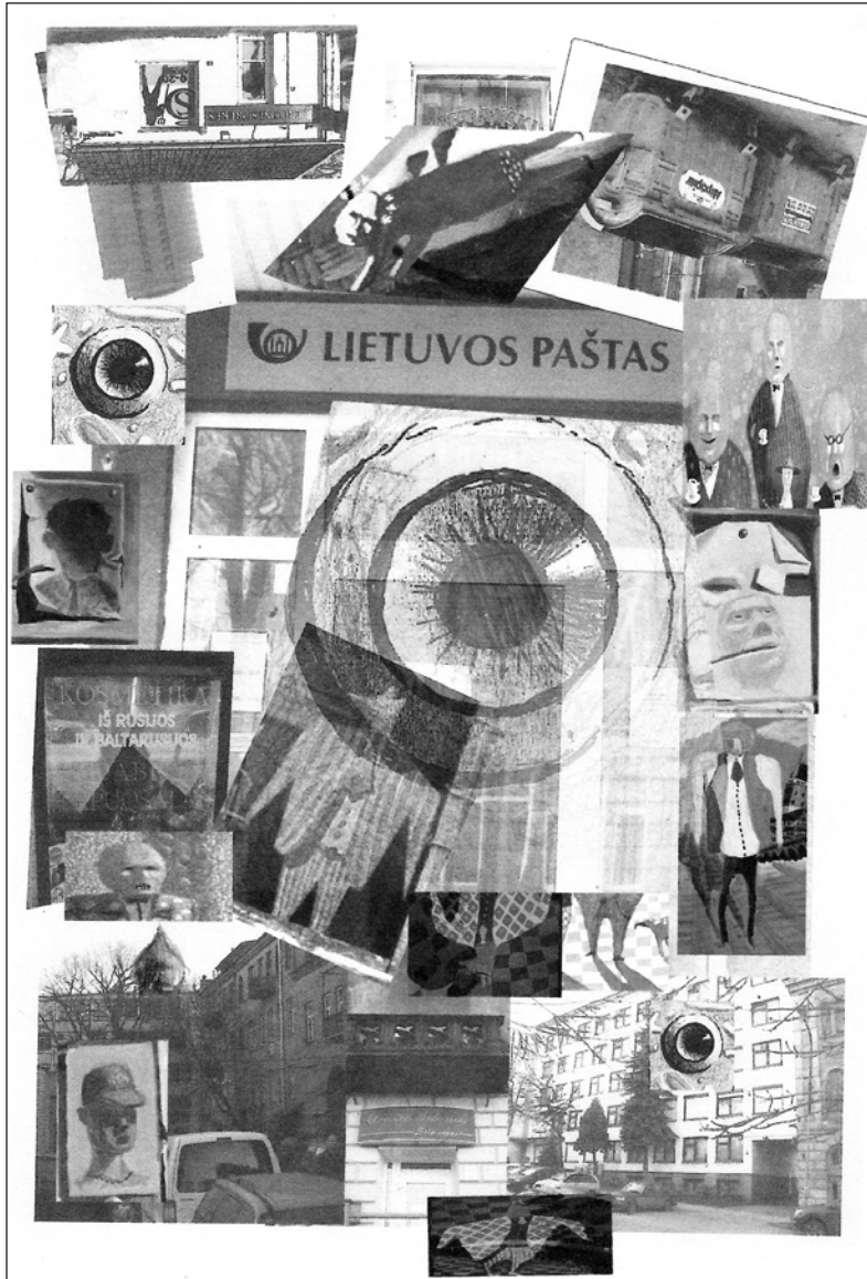
Politinis kasdienybės teatras*