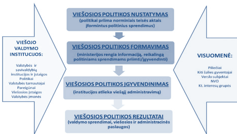
1 pav. Viešasis valdymas Lietuvoje

Viešojo politika nustatoma ir formuojama priimančiam tam tikrus valdymo sprendimus, kuriais valstybė išreiškia valią tam tikru visuomenei ar visai valstybei svarbiu klausimu. Kad sprendimai atitiktų visuomenės poreikius, jie turi būti priimami dalyvaujant kuo platesniam visuomenės atstovų būriui. Tai, remiantis naujojo viešojo valdymo principais, viešojo valdymo procese, iškeliant aktualias problemas, formuluojant viešąją politiką, svarstant visuomenei svarbius projektus, juos tvirtinant ir įgyvendinant, greta valdžios institucijų privalo dalyvauti ir kitos suinteresuotosios šalys (1 pav.).