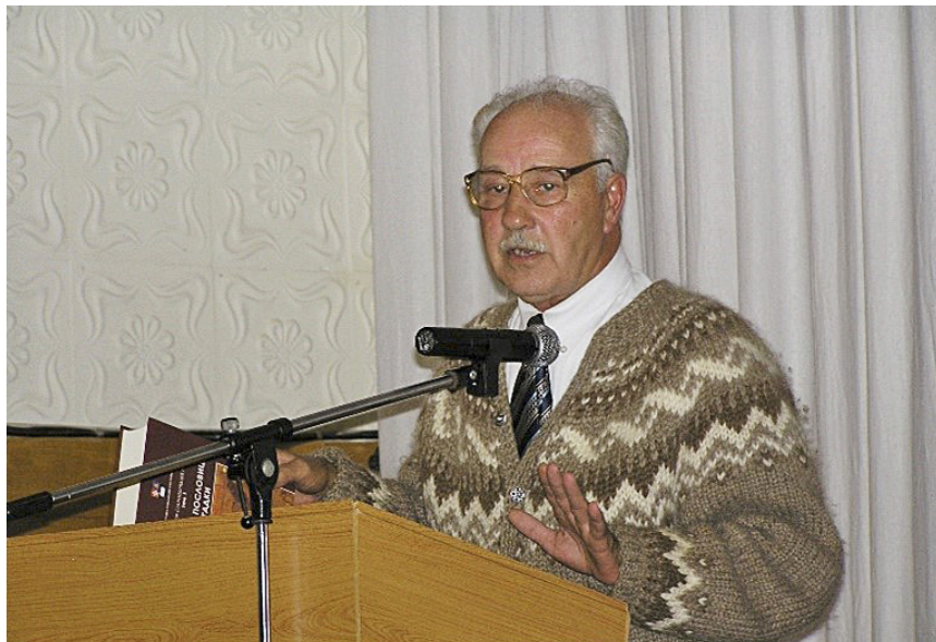
Традиционная конференция «Рябининские чтения». Петрозаводск, сентябрь 2007 г.