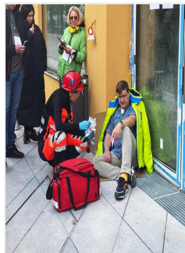
XIV Lietuvos greitosios medicinos pagalbos darbuotojų žaidynių akimirkos

Antrąją GMP žaidynių dieną veiksmas persikėlė į Laisvės alėją, barą „Lizdas“, prie kavinės „Odesa“, į viešbutį „Radisson“, taip pat į Nemuno ir Neries santakos parką. Čia buvo sukurtos suaugusio žmogaus gaivinimo,