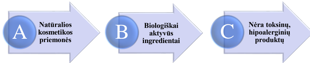
2 pav. Kosmetikos priemonių grupės pagal sudėtį

Senėjimą stabdančios priemonės, pvz., odos drėkikliai, makiažui buvo naudojami, siekiant pagerinti veido išvaizdą [4]. Kosmetinės priemonės pagal sudėtį skirstomos į grupes: natūralios kosmetikos priemonės, biologiškai aktyvios, kosmetinės priemonės be alergenų (2 pav.).