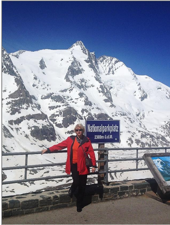
Sielą atgaivina kelionių įspūdžiai.