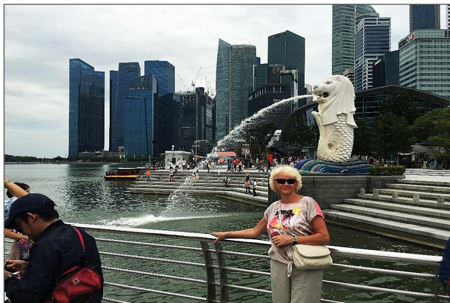
Sielą atgaivina kelionių įspūdžiai.