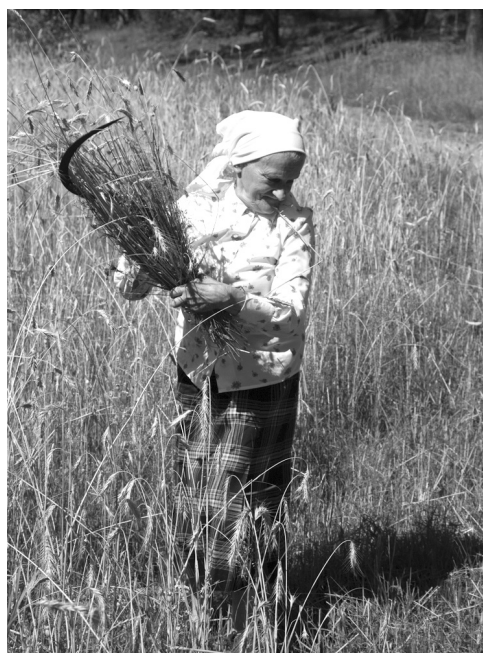
Arūno Baltėno fotografijos iš ciklo „Šilų dzūkai“, 2006–2008

Jie, rodos, dar lengvai įsilieja į mažai laiko tepaliestą šimtametės tradicijos tėkmę bei leidžiasi sugražinami dar žingsnelį atgalios – paprašytos moterys dar gali išeiti pasipuošusios su pjautuvais į rugių lauką, prieš pradėdamos darbą – persižegnoti... Kita vertus, namuose duoną kepančios ar uogynuose giedančios dzūkų moterys – gal jau paskutinė tai gebančiųjų karta.