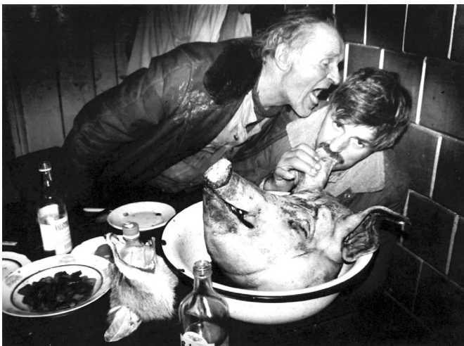
Rimaldo Vikšraičio fotografijos iš ciklų „Pavargusio kaimo grimasos“, 1976–2001, „Skerstuvės“, 1982–1986