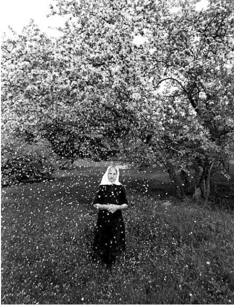
Romualdo Rakausko fotografija iš ciklo „Žydėjimas“, 1962–1971

bieta Čeplickiene aprašymas nuskamba tarsi prierasas prie R. Rakausko fotografijos: