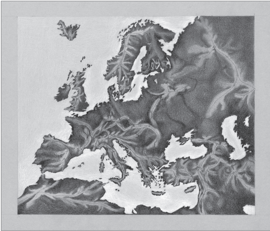
Гедрюс Йонайтис. Барельефное изображение Европы из Шести Карт Европы Карла Риттера (1806).

Уже после публикации статьи, возвращаясь к Вечерам , Гоголь пишет (или продолжает писать) «Страшную месь», в которую переносит тот же самый обращенный на карту взгляд и воспроизводит космический «вид» Карпатских гор: «громадою стали в виде подковы между галичским и венгерским народом» (Гоголь 1940: 271. Курсив мой. – И. В. ). Определить форму и расположение горного массива в начале XIX в. можно было только с помощью рельефной карты (это одна из Карт Европы Риттера, которую Гоголь в статье упоминает).