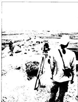
Matavimai nelegalių kasinėjimų sužalotame objekte Koške Bohar

Vėlesnių nei akmens amžiaus epochų archeologijos paminklai aptinkami ir lokalizuojami pagal natūralios erozijos bei nelegalių kasinėjimų metu į žemės paviršių iškeltą keramiką. Žvalgytųjų metu Goro provincijoje aptikti archeologijos paminklai yra palikti ankstyvųjų žemdirbių, priklauso Okso kultūriniam kompleksui, ir bronzos amžiaus (3300–2500 m. pr. Kr.) Helmando kultūrai. Hari Rudo (Arijaus) upė, žemupyje Turkmėnistane turinti Tedženo vardą, baigiasi ankstyvųjų žemdirbių Tedženo oaze. Ši upė, tarsi kultūrų tiltas, jungė dabartinio Turkmėnistano ankstyvosios žemdirbystės centrą su Indo upės žemdirbių civilizacijos regionu. Šių kultūrų paminklai paplitę derlinguose Hari Rudo slėniuose. Vienas ryškiausių tokių paminklų yra ekspedicijų metu aptikta Pumbakaro daugiasluoksnė gyvenvietė ir tapa kompleksas. Šios epochos keramikos, datuojamos IV–III tūkstm. pr. Kr., surasta ir Ahangarano apylinkėse 13 . Kur kas daugiau pavyko aptikti ankstyvojo