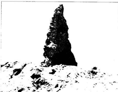
Puodų šukių gausa žemės paviršiuje Koške Bohar Lietaus ir vėjo ardomas bokštas Sare Ahangaran

Kai kurie nelegalių kasinėjimų metu aptikti radiniai iki šiol liko Afganistane. Ekspedicijos dalyviams teko matyti archeologijos vertybių ne tik Kabulo antikvarų kvartale Viščiukų gatvėje, bet ir Goro provincijos prekeivių rankose. Vienintelė optimistiškai nuteikianti žinia yra ta, kad šiuo metu vertingiausi Afganistano paveldo objektai (pvz., Džamo minaretas Gore) yra saugomi policijos. Džiugu, kad ekspedicijai lankantis tuose pačiuose objektuose po kelis kartus, naujų kasinėjimų neužfiksuota.