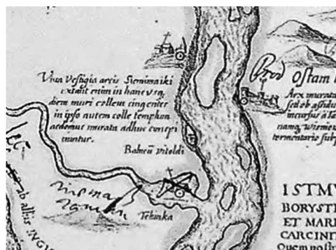
Рис. 2. Фрагмент карты 1643 г.