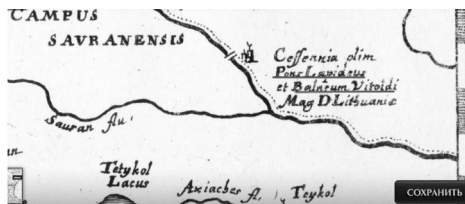
Рис. 9. Фрагмент карты 1657 г.