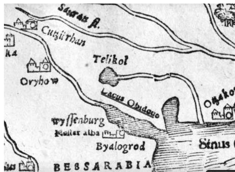
Рис. 7. Фрагмент карты 1540 г.