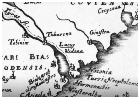
Рис. 6. Фрагмент карты 1657 г.