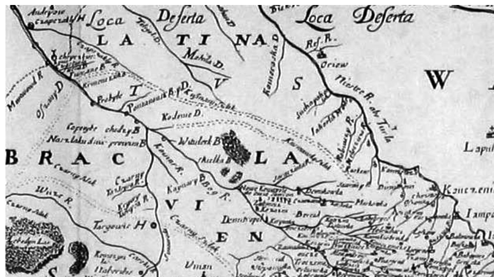
Рис. 3. Фрагмент карты 1650 г.