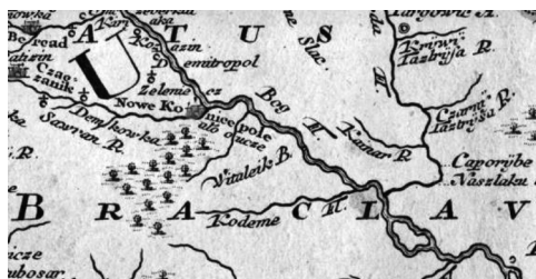
Рис. 10. Фрагмент карты 1742 г.