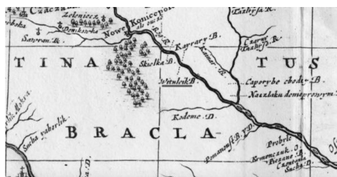
Рис. 8. Фрагмент карты 1681 г.