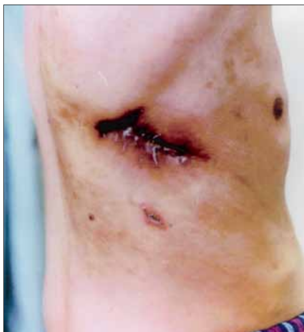
5 pav. Atviruoju būdu gydoma pleurostomos anga po liekamosios pleuros ertmės plastikos didžiąja taukine