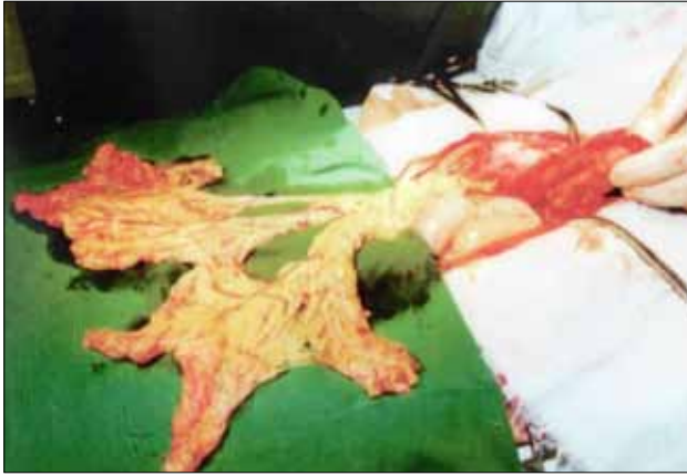
6 pav. Didžioji taukinė, omentum majus