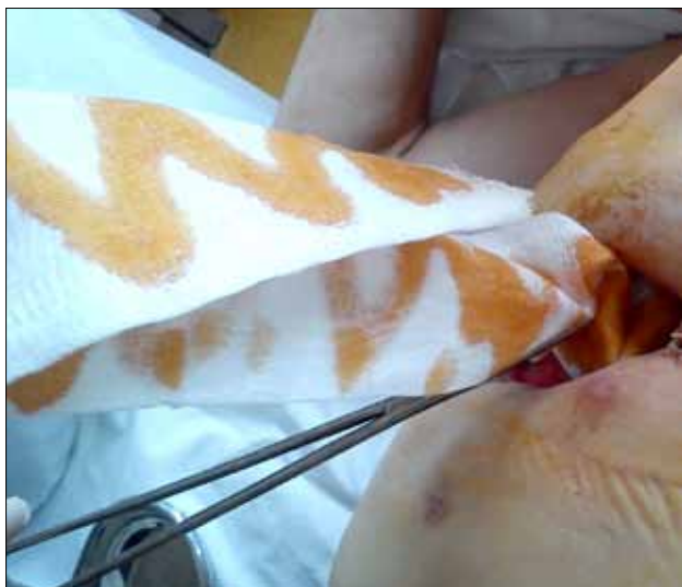
2 pav. Pleurostomos perrišimas