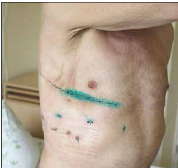
8 pav. Vaizdas po torakoplastikos (5 šonkaulių rezekcijos)

per viršutinės vidurinės laparotomijos pjūvį (6 pav.). Išsaugojome a. gastroepiploica dex. , kaip vienintelį didžiosios taukinės kraujotakos šaltinį, o ją pačią per 3–4 cm ilgio pjūvelį priekinėje kairiojo diafragmos kupolo dalyje perkėlėme į LPE. Atnaujinome pleurostomos kraštus, susiauriname jos angą, likusią nesusiūtą dalį gydėme atviru būdu (5 pav.). Pacientas pasveiko.