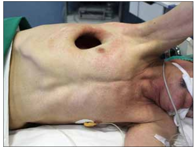
1 pav. Suformuota pleurostoma

pavyzdžiui, iširti siūlė ar net susidaryti krūtinės sienos flegmona. Tinkamai suformuota pleurostoma sumažina nemalonius pojūčius keičiant setonus pleuros ertmėje ir suteikia geresnę estetinį vaizdą, kuris turi įtakos tiek paciento, tiek jo artimųjų psichologinei būsenai (1 pav.).