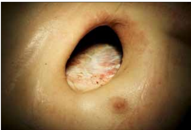
7 pav. Išsivaliusi, plastikai tinkama, liekamoji pleuros ertmė