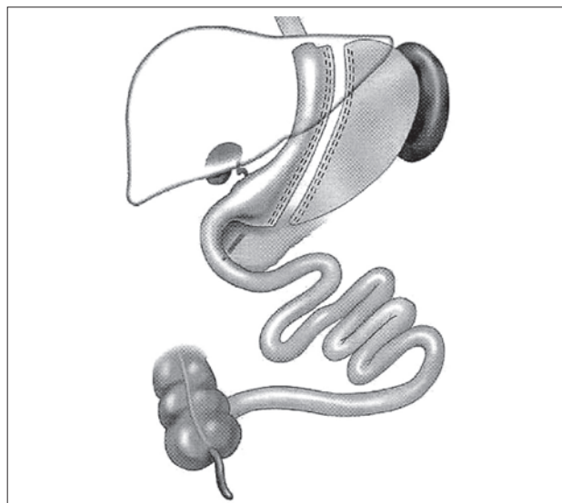
1 pav. Magenstrasse ir Mill operacijos schema

Magenstrasse ir Mill operacija pirmą kartą Lietuvoje atlikta 2004 metų rugpjūčio 20 dieną 51 metų vyriui. Indikacijos operuoti buvo paciento antsvoris (KMI = 35), sunkiai koreguojama hipertenzija (AKS 170/110 mmHg), metabolizmo sutrikimai (cholesterolio kiekis 8,5 mmol/l) ir skausmai juosmens srityje. Kardiologas rekomendavo aukštą kraujospūdį gydyti vaistais ir mažinti svorį. Keletą kartų dieta ir fiziniu krūviu pacientui pasisekė sumažinti svorį 15 kg