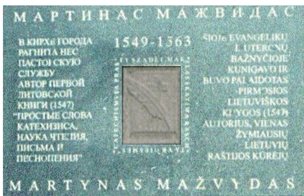
Рисунок 4: Мемориальная доска Мартинасу Мажвидасу в Немане

Праздничные мероприятия проводились и на местах жительства Мажвидаса. Министерство Культуры Литвы выполняя Государственную программу по поводу юбилея 450-той годовщины первой литовской книги Мартинаса Мажвидаса (3 веб-ссылка) организовала несколько мероприятий. В Немане была открыта мемориальная доска Мартинасу Мажвидасу на башне костела, где он работал пастором (Рис. 4).