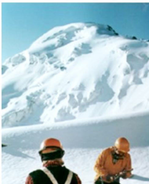
Рисунок 1: Вершина Мажвидаса в горах Тянь-Шань (17 веб-ссылка)

В Институте Математики и Информатики, на кафедре ЮНЕСКО «Информатика для Гуманитариев» был издан компакт-диск «Год литовской книги» (Lietuviškos knygos metai) (4 веб-ссылка). В нем находится информация, полностью охватывающая мероприятия, которые были организованы во всем мире по поводу юбилея издания первой литовской книги (Mažvydas 1547): выставки, встречи, заседания, памятники. Одним из памятников является вершина в горах Тянь-Шань, которая носит имя «Мажвидас» (Рис. 1).