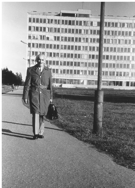
Pakeliui iš Saulėtekio į namus. 1986 metai.

Disertacija buvo ginama Sankt Peterburgo (anuomet – Leningradas) Kultūros institute. Giliai įstrigo širdin viena jaudinanti aplinkybė. Nors Profesorių jau tada vargino sveikatos negalavimai, tačiau jis nedvejodamas kartu leidosi į tolimą kelionę. Tuomet jo veidas švietė tokiu draugiškumu, tokia tėviška paguoda, kad visas jaudulys pamažu išstirpo, grįžo pasitikėjimas tuo, ką buvome