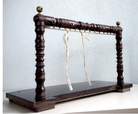
6 ILIISTRACIJA. Knygų siuvimo rėmas