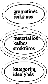
2 schema. “Kalbotyros” dalyko sąvokos struktūra

Taip interpretuojant kalbos reiškinį, turime pabrėžti, kad gramatinių reikšmių ir kalbos formų turinio idealybių (effets de sens ir valeurs) vienio idėja buvo suformuluota prancūzų lingvisto G.Gijomo (1883-1960), tačiau šių sąvokų turinys buvo analizuojamas semantinės kalbos sampratos rėmuose, nes nebuvo keliama kalbos reiškinio apibrėžimo problema.