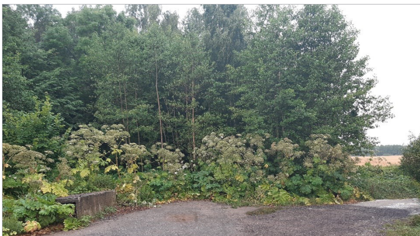
1 pav. Sosnovskio barščių sąžalynas Klaipėdos r. savivaldybės teritorijoje

Dabar Sosnovskio barščiai paplitę visoje Lietuvoje. Jie auga įvairiose antropogeninėse buveinėse, pavyzdžiui, pievose, pamiškėse, vandens telkinių pakrantėse ir pamiškėse [3]. Sosnovskio barščio išplitimo tankumas labai nevienodas – daug kur jo augama pavieniui ar nedidelėmis grupelėmis, kitur matyti tankūs šio augalo sąžalynai (žr. 1 pav.) [6].