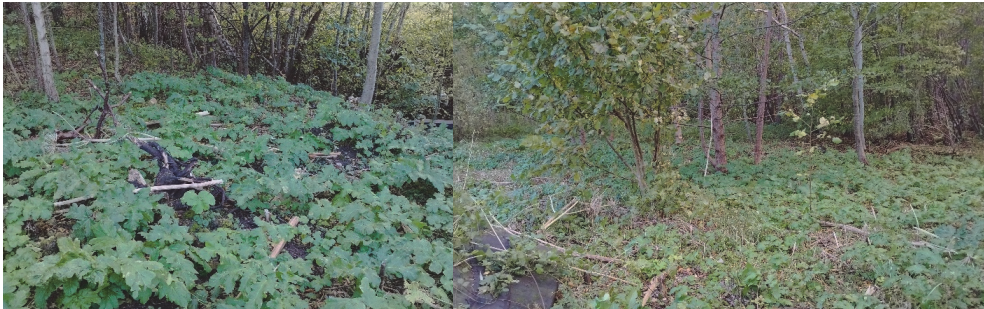
2 pav. Sosnovskio barščio augimvietė Klaipėdos r. savivaldybės teritorijoje

Kretingalės sen. esančioje Sosnovskio barščių augimvietėje buvo rasti nušienauti, maždaug 30 cm nuo žemės, invazinio augalo sąžalynai (žr. 2 pav.). Nupjauti augalai su akivaizdžiais žiedynais buvo palikti, taip leidžiant sėkloms vėl patekti į atvirą dirvožemį ir kitais metais sudygti. Likusieji individai dengė pusę tiriamojo lauko, gyvybingų žiedynų matyti nebuvo. Suskaičiuoti invazinių augalų vidurkiai parodė, kad daugiausiai buvo individų, kurių aukštis neviršijo 30 cm (žr. 3 pav.). Tai rodo, kad mechaninis naikinimas nėra efektyvus kovojant su Sosnovskio barščio plitimu ir netgi gali tik paskatinti dar didesnę šio invazinio augalo plitimą į gretimas teritorijas.