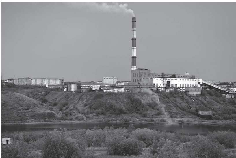
Tebeveikianti „Vorkutinskaja“ šachta Vorkutoje

simbolizuoja spygliuotos vielos liekanos. Kur ne kur dar matosi betono liekanos, buvusių kelių žymės. Viskas pasmerkta sunykti, kaip to ir buvo siekta.