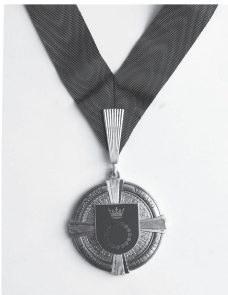
Jonui Žemaičiui-Vytautui skirtas paausuotas Palangos miesto garbės piliečio ženklas