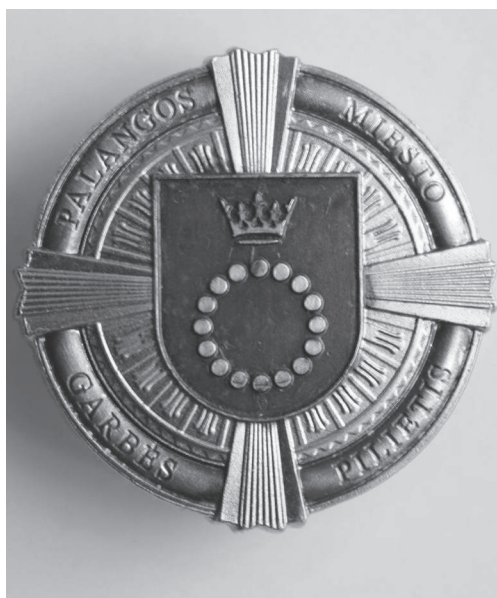
Palangos miesto garbės piliečio ženklų miniatiūra