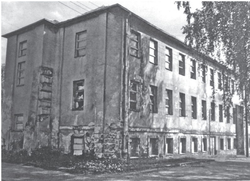
Buvusios Jiezno vidurinės mokyklos pagrindinis korpusas ir Jiezno rajono liaudies švietimo skyriaus patalpos. Iš šio pastato buvo išnešta rašomoji mašinėlė