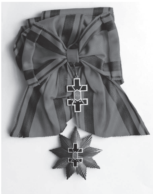
Vyčio Kryžiaus 1-ojo laipsnio ordinas, kuriuo Jonas Žemaitis-Vytautas po mirties apdovanotas 1997 m.