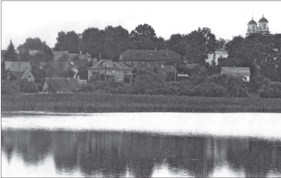
Vakarinėje Jiezno ežero pakrantėje pagrindinės organizacijos nariai aptardavo strateginius planus ateičiai. Čia buvo svarstomi ir aprobuoti organizacijos narių įstatai