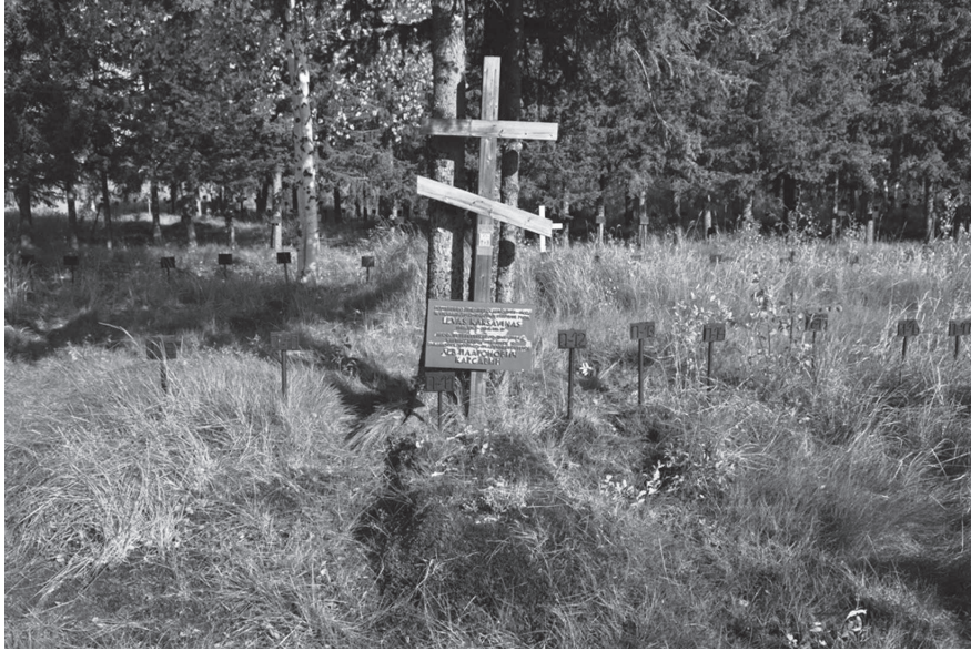
Abezės memorialinės kapinės. Levo Karsavino kapas