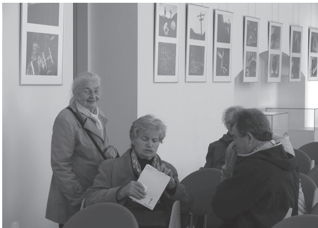
Lankytojai apžiūri Dimitrijaus Vyšomirskio fotografijų parodą „GULAG'o pėdsakai“