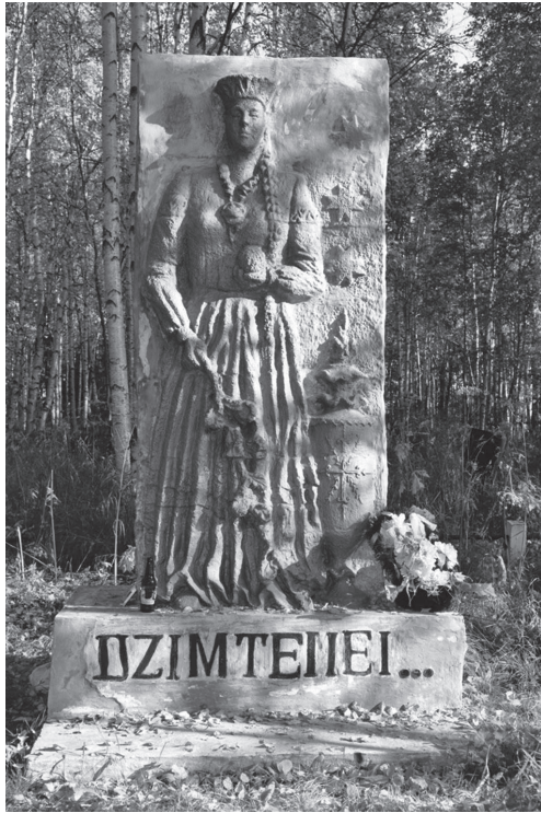
Paminklas latvių tremtiniams Intos Vostočnyje kapinėse