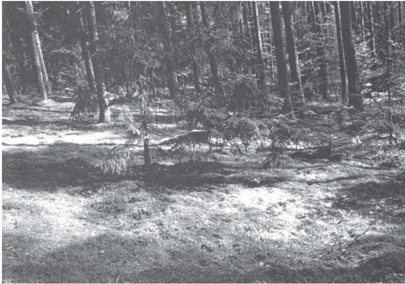
Šioje vietoje Nemajūnų šilelyje vyko pagrindinės organizacijos – Lietuvos jaunųjų partizanų Erelio būrio – narių sąskrydis

Sąskrydžio atidarymo dieną prieigose buvo iškabintos Lietuvos trispalvės vėliavėlės. Į sąskrydį atvyko organizacijos nariai ne tik iš Nemajūnų, bet ir iš Jiezno, Punios, Užuguoščio, Stakliškių apylinkių. Atvykusieji buvo supažindinti su sąskrydžio taisyklėmis, kurių privalėjo laikytis kiekvienas.