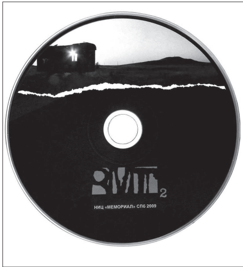
Kompaktinė plokštelė „Virtualusis GULAG'o muziejus“