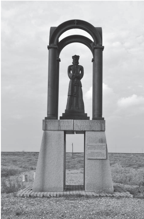
Paminklas Jur Šore

dinimo angos, barakus juosusios spygliuotos vielos liekanos. Dar riogso apgriuvęs paminklas, skirtas pirmajai šachtai. Prieš penkerius metus čia stovėjo pagrindinis pastatas, menantis senuosius laikus, tačiau jis jau nugriautas. Vargu ar buvę kaliniai atpažintų šias vietas, giliai išpaudusias žaizdas į jų širdis, menančias jų vargus ir prarastus gyvenimo metus.