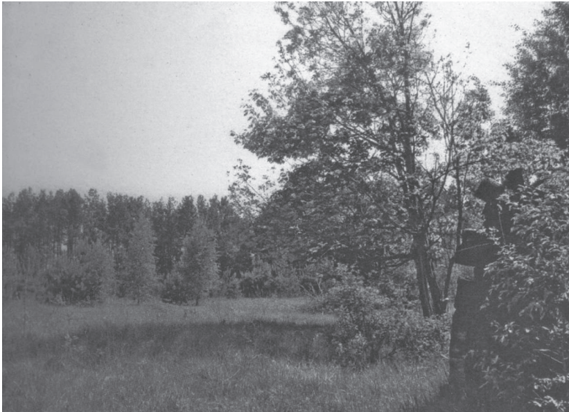
Šioje vietoje Jiezno rajone Liciškėnų kaime stovėjo bokštas, kuriame Naujųjų 1954-ųjų išvakarėse buvo iškelta Lietuvos trispalvė