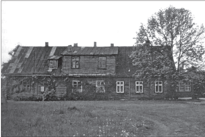
Vienas iš Jiezno vidurinės mokyklos korpusų, kuriame buvo įkurta pagrindinė antiso- vietinė organizacija – Erelio būrys