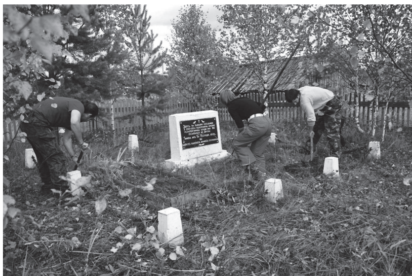
Tvarkomas Ust Lokčimo memorialas