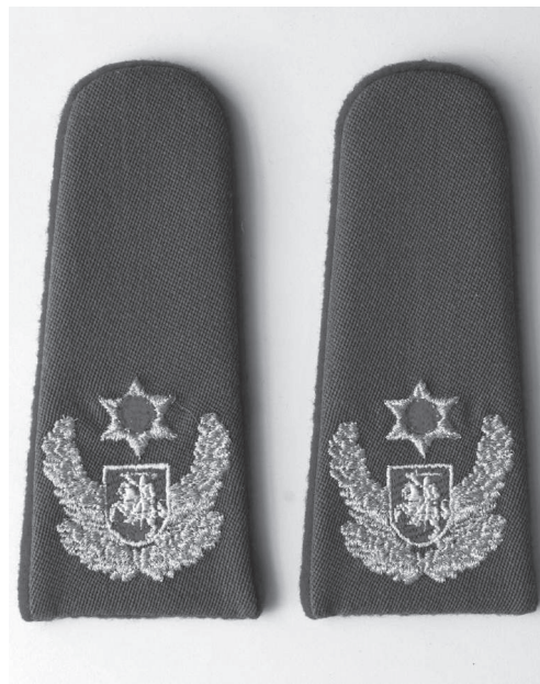
Brigados generolo antpečiai, suteikti Jonui Žemaičiui-Vytautui po mirties 1998 m.