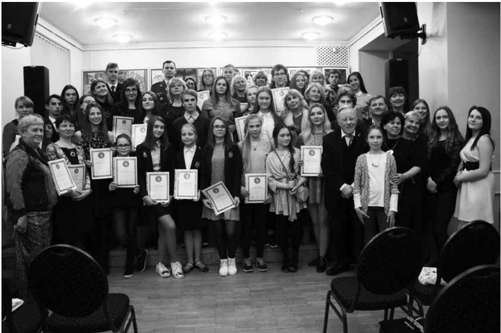
Konkurso „Lietuvos kovų už laisvę ir netekčių istorija“ laureatai

vanojimo renginys. Konkursas vyko jau 17-ą kartą, jame šiais metais dalyvavo 821 mokinys iš Lietuvos ir lietuviškų mokyklų