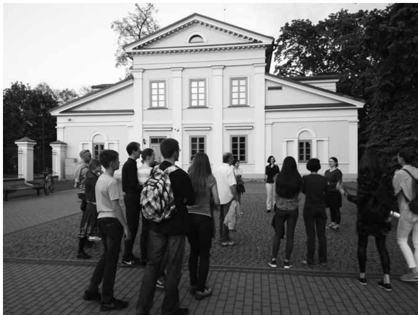
„Muziejų nakties 2017“ ekskursija po Tuskulėnų memorialinį kompleksą

visi norintieji galėjo dalyvauti režisieriaus Audriaus Juzėno vaidybinio filmo „Ekskursantė“ peržiūroje. Renginių programą užbai-