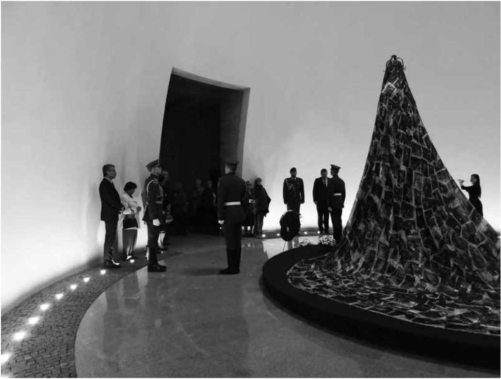
Sovietinio totalitarinio režimo aukų pagerbimo ceremonija koplyčioje-kolumbariume

Rugsėjo 23-iają , minint Lietuvos žydų genocido aukų atminimo dieną, Tuskulėnų memorialiniame komplekse vyko atvirų durų diena. Lankytojai galėjo nemokamai apžiūrėti muziejinę ekspoziciją „Tuskulėnų dvaro paslaptys“.