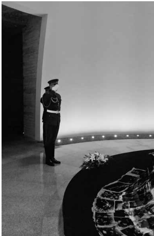
Lietuvos kariuomenės Garbės sargybos kuopos kariai pagerbia Tuskulėnų aukas koplyčioje-kolumbariume

fotodokumentinę parodą „Lietuviškoji leidyba Vakarų Europoje 1945–1952 m.“ ir apsilankyti koplyčioje-kolumbariume“. Birželio 14-ąją, minint Lietuvos gyventojų pirmųjų masinių trėmimų ir žudynių metines, Lietuvos kariuomenės Garbės sargybos kuopos kariai koplyčioje-kolumbariume pagerbė sovietinio totalitarinio režimo aukas ir padėjo gėlių vainiką.