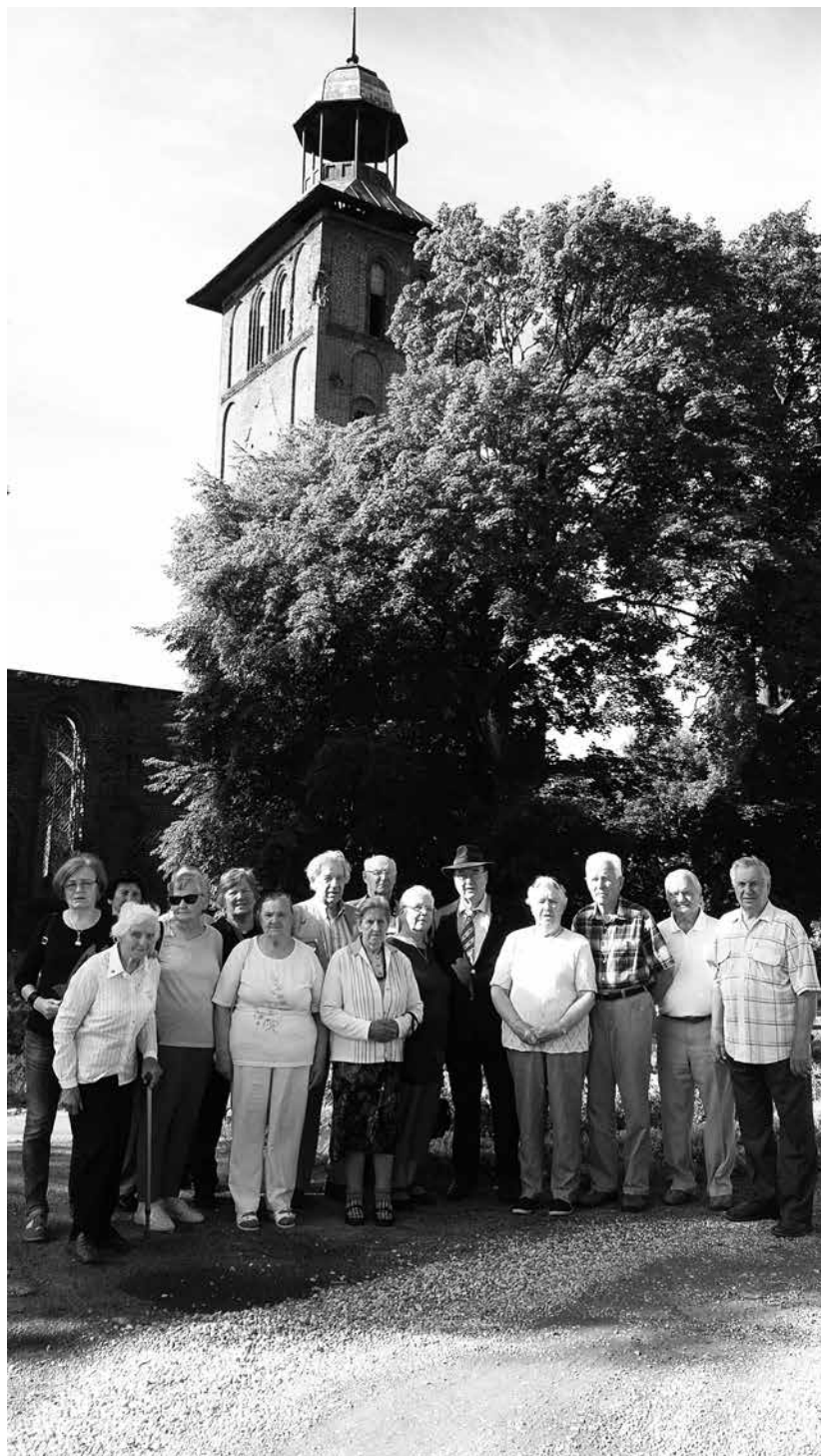
Pažintinės ekskursijos dalyviai prie apleistos Šv. Jokūbo evangelikų liuteronų bažnyčios Vėluvoje