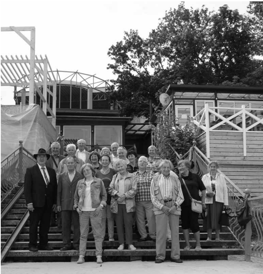
Pažintinės ekskursijos dalyviai kurortiniame Baltijos pajūrio mieste Naujuose Kuršiuose

2017 m. rugpjūčio 3 d. pirmoje dienos pusėje lankėmės Naujuose Kuršiuose (vok.