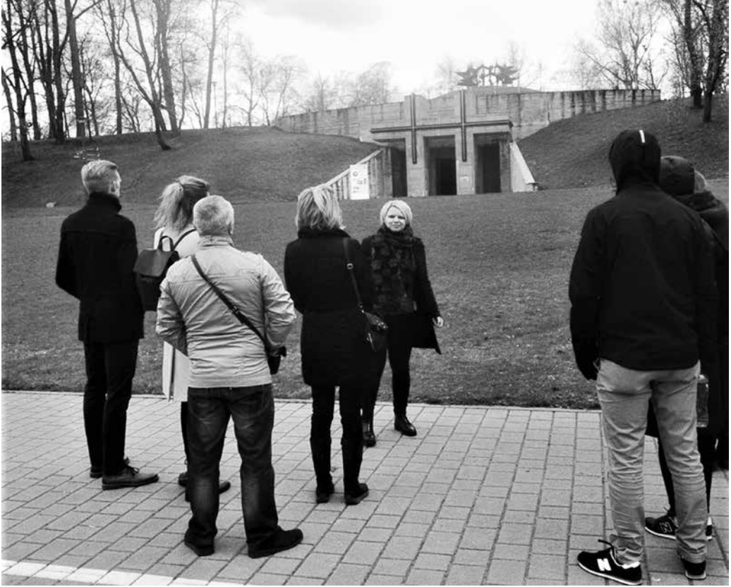
„Open House Vilnius 2017“ ekskursijos dalyviai klausosi gidės pasakojimo apie Tuskulėnų memorialinį kompleksą