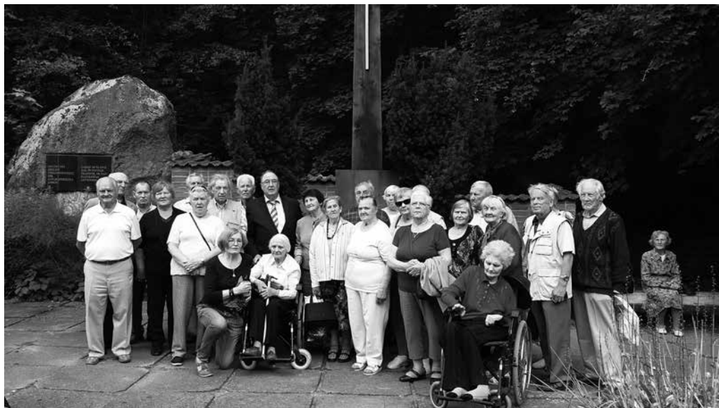
Ekskursijos dalyviai prie paminklinio kryžiaus, skirto nužudytiems ir nuo bado mirusiems Rytų Prūsijos gyventojams atminti

skirto nužudytiems ir nuo bado mirusiems Rytų Prūsijos gyventojams atminti, surengta šių aukų pagerbimo ceremonija. Sugiedoti Lietuvos Respublikos ir Vokietijos Federacinės Respublikos himnai. Žodį tarė Lietuvos garbės konsulas Vokietijos Federacinės Res-