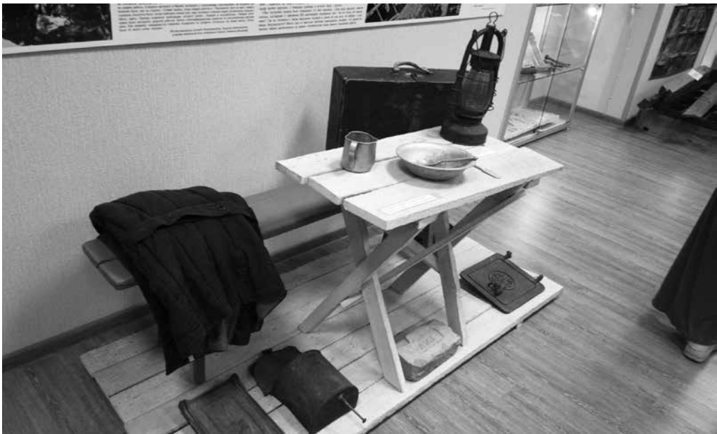
Belomoro kanalą tiesiusių Belbaltlago kalinių barako interjero ekspozicija Medvežjegorsko rajono muziejuje