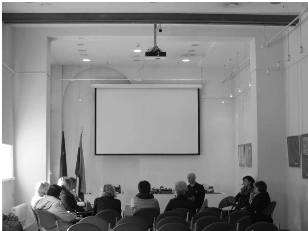
Akimirka iš renginio „Menų dūzgės: mokinių mokymosi edukacinėse aplinkose galimybės“

Balandžio 22–23 d. Tuskulėnų memorialinio komplekso koplyčia-kolumbariumas dalyvavo atviros architektūros savaitgalyje „Open House Vilnius 2017“. Renginio gidai-savanoriai susirinkusiems vilniečiams ir miesto svečiams pristatė unikalaus statinio istoriją. Šeštadienį Konferencijų salėje, skambant kanklių ir fleitos garsams, buvo skaitomi KGB kalėjime kalėjusių, kankintų ir Tuskulėnų dvaro teritorijoje užkastų žmonių laišakai. Renginyje apsilankė 336 lankytojai.