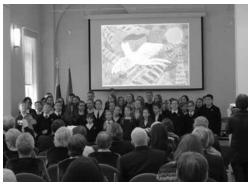
Tautines dainas atlieka Tuskulėnų gimnazijos jaunių choras