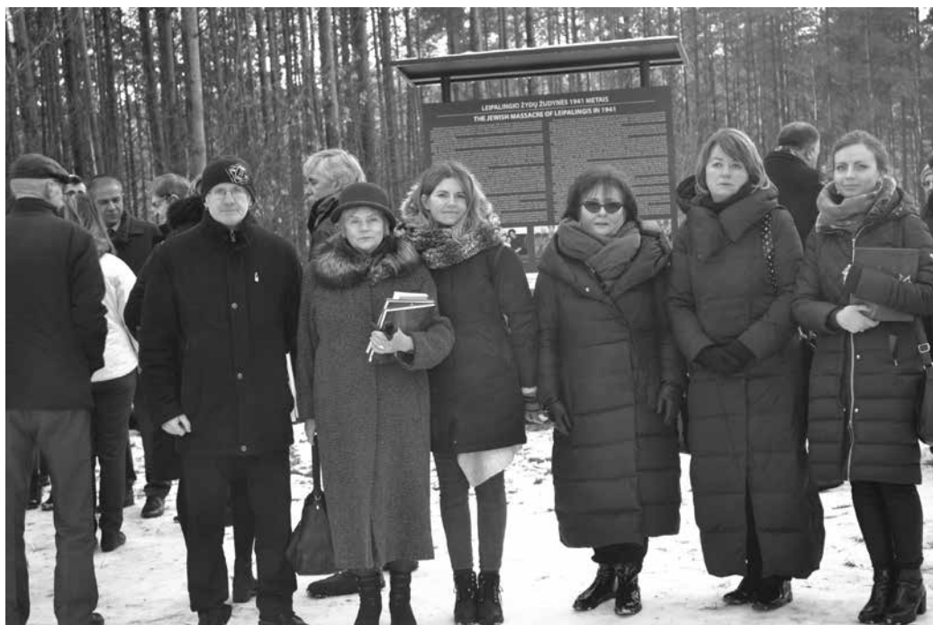
LGGRTC atstovai prie stendo, skirto 1941 m. nužudytiems Leipalingio žydams atminti