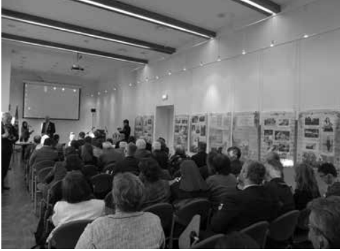
Akimirka iš seminaro „Europos romų genocidas 1939–1945 metais“

„Tuskulėnų dvaro paslaptys“, Konferencijų salėje eksponuojamą Lietuvos dailės muziejaus kilnojamąją parodą „XIX a. II p.–XX a. pr. Lietuvos valstybės politikos, kultūros, mokslo, visuomenės elitas ir jo aplinka“ ir apsilankyti koplyčioje-kolumbariume. Mažiausieji Tuskulėnų memorialinio komplekso lankytojai pynė tautinių spalvų apyrankes, atliko edukacines užduotis. Tądien muziejuje apsilankė 182 žmonės.