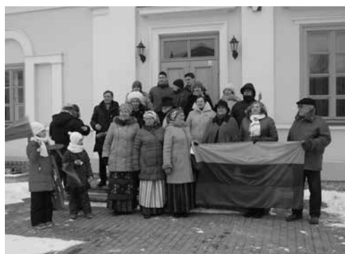
Tuskulėnų memorialinio komplekso svečiai gieda giesmę „Lietuva brangi“

Kovo 11-ąją Tuskulėnų memorialiniame komplekse vyko atvirų durų diena. Lankytojai galėjo apžiūrėti ekspoziciją