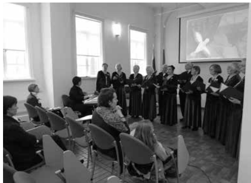
Dainuoja Vilniaus „Bočių“ bendrijos choras „Ainiai“

Vasario 16 d. Tuskulėnų memorialiniame komplekse vyko renginiai, skirti Lietuvos valstybės atkūrimo šimtmečiui paminėti. Vilniečiai ir miesto svečiai galėjo nemokamai apžiūrėti ekspoziciją „Tuskulėnų dvaro paslaptys“, Moldovos Respublikos parodą „Besarabai Gulage“ ir apsilankyti koplyčioje-kolumbariume. Konferencijų salėje vyko Vilniaus „Bočių“ bendrijos choro „Ainiai“ ir Tuskulėnų gimnazijos