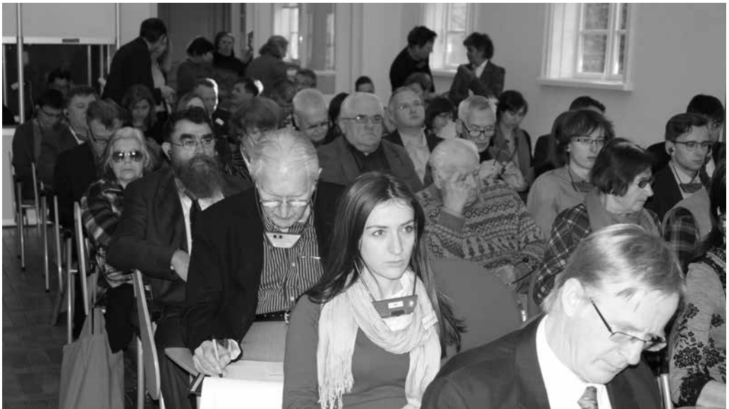
Akimirka iš konferencijos „Europos romų genocidas 1939–1945 m.“