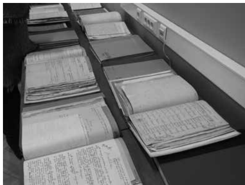
Adolfo Ramanausko-Vanago baudžiamosios bylos tomai