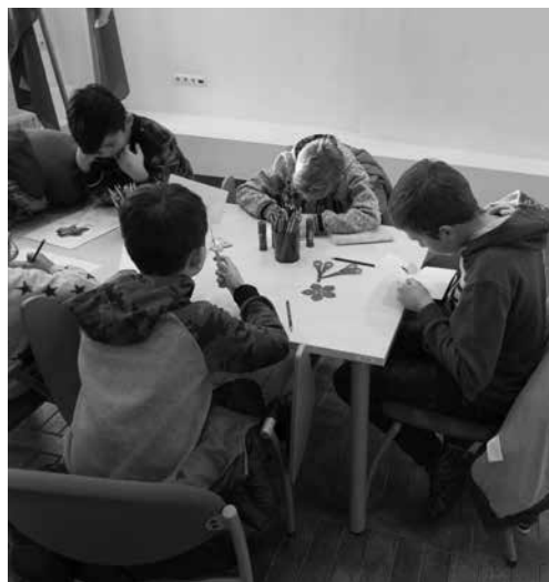
Patys mažiausi Tuskulėnų memorialinio komplekso svečiai dalyvauja edukaciniame užsiėmime „Pasidaryk neužmirštuolės žiedą“

Sausio 12-ąją ir 13-ąją Tuskulėnų rimities parko memorialiniame komplekse vyko atvirų durų dienos. Lankytojai galėjo nemokamai apžiūrėti ekspoziciją „Tuskulėnų dvaro paslaptys“, Konferencijų salėje eksponuojamą nacionalinio mokinių konkurso „Lietuvos kovų už laisvę ir netekčių istorija“ dalyvių darbų parodą ir koplyčioje-kolumbariume pagerbti žuvusiuosius už Lietuvos laisvę. Lankytojai, tarp kurių buvo nemažai moksleivių, dalyvavo