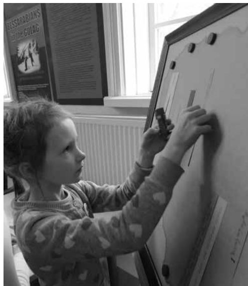
Akimirka iš Lietuvos valstybės atkūrimo šimtmečiui skirto renginio

jaunių choro koncertas. Skambėjo gerai žinomos tautinės dainos, buvo atliekamos sutartinės. Vėliau visi norintieji Tuskulėnų dvaro rūmų kieme giedojo giesmę „Lietuva brangi“.