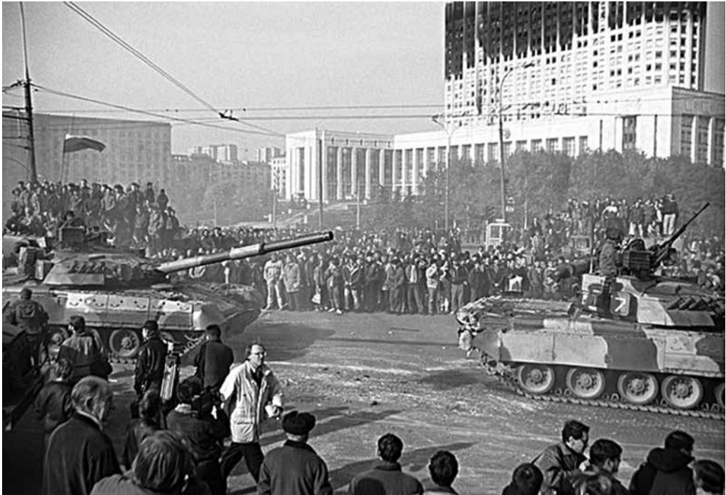
1993 m. spalio 4 d. B. Jelcinas įsakė šturmuoti Baltuosius (parlamento) rūmus.

1993 m. B. Jelcinas savo autoritarinį valdymą įtvirtino kaip kovotojas su komunistinės sistemos restauratoriais. Tačiau jis buvo įtvirtintas paneigiant teisinės valstybės ir liberaliosios demokratijos principus. Nors didžioji dalis Rusijos visuomenės tai jam ir atleido, artėjant 1996 m. Rusijos prezidento rinkimams B. Jelcinas jokių Rusijos ateities vizijų pasiūlęs nebuvo ir pasiūlyti negalėjo. Tuo tarpu tuometinė padėtis netenkino absoliučios visuomenės daugumos*. Todėl rinkimus jis galėjo laimėti tik remdamasis savo senu