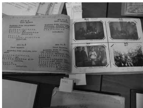
Tauro apygardos partizanų albumas, padovanotas Adolfui Ramanauskui-Vanagai. Paskutiniame albumo puslapyje yra A. Ramanausko įrašas: „Šias nuotraukas gavau atminčiai keliaudamas – vizituodamas Tauro apygardoje veikiančius organizacinius vienetus.“