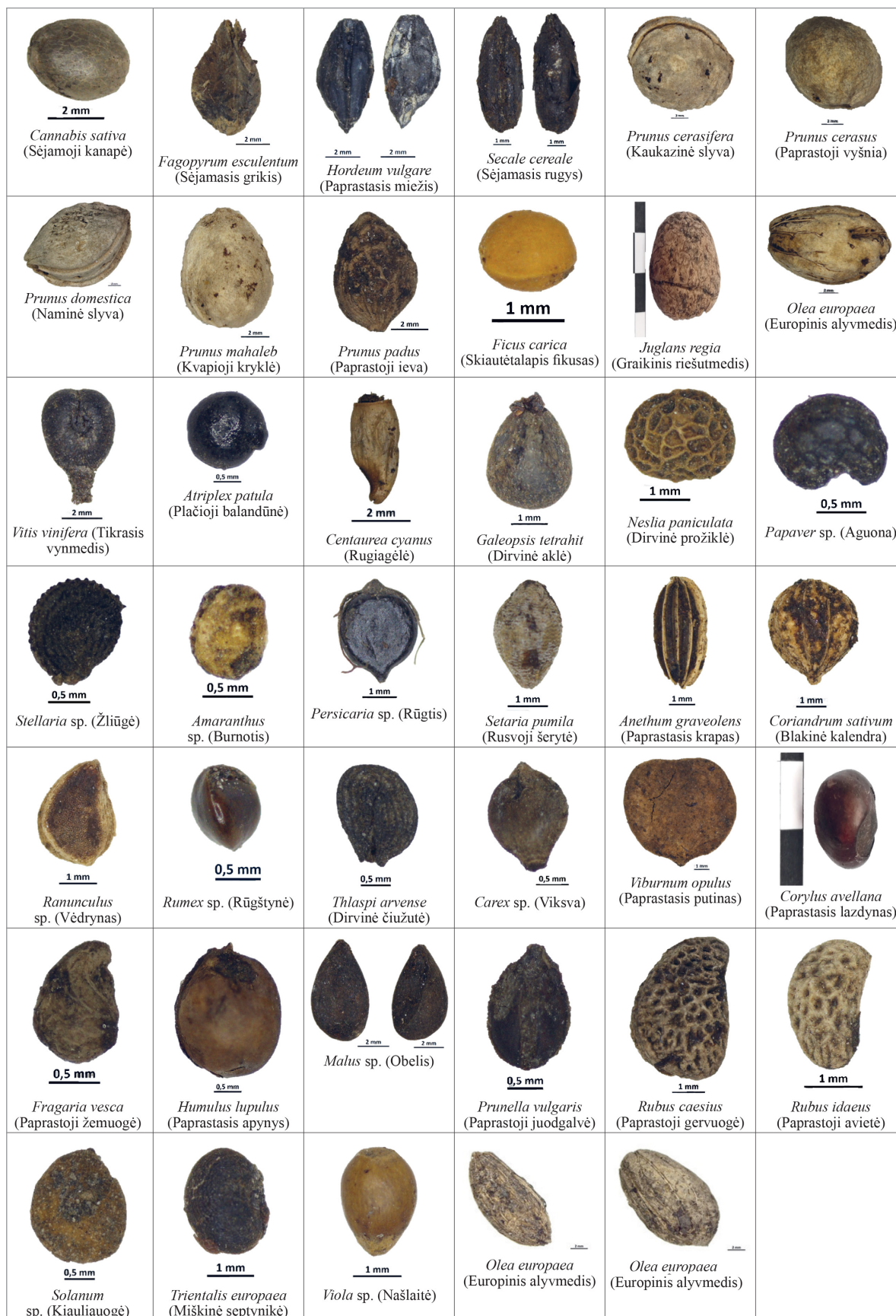
3 pav. Archeobotaninių tyrimų metu identifikuoti augalai