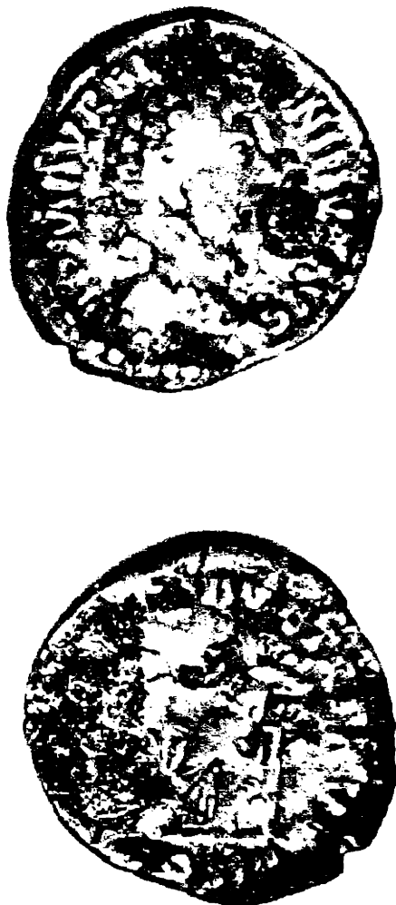
Рис. 2. Денарий Марка Аврелия. Серебро. Av.: IMP MAVREL ANT/O/NINVS/S/ /A/VG. Голова Марка Аврелия вправо. Rv./CONCOR/D AVG TRP XVI. Внизу: COS III. Конкордия (Согласие) сидящая влево. Ø 18,5 mm, вес 2,8729 гр. (увеличено в 4 раза).

ной поверхностью в развале печи – каменки в заполненной типично банщеровской полужемлянки не является достаточным основанием для отнесения этого памятника к культуре штрихованной керамики. Подобные находки скорее лишь свидетельствуют о доживании реликтового разрозненного населения культуры штрихованной керамики в отдельных случаях до середины I тысячелетия н. э.