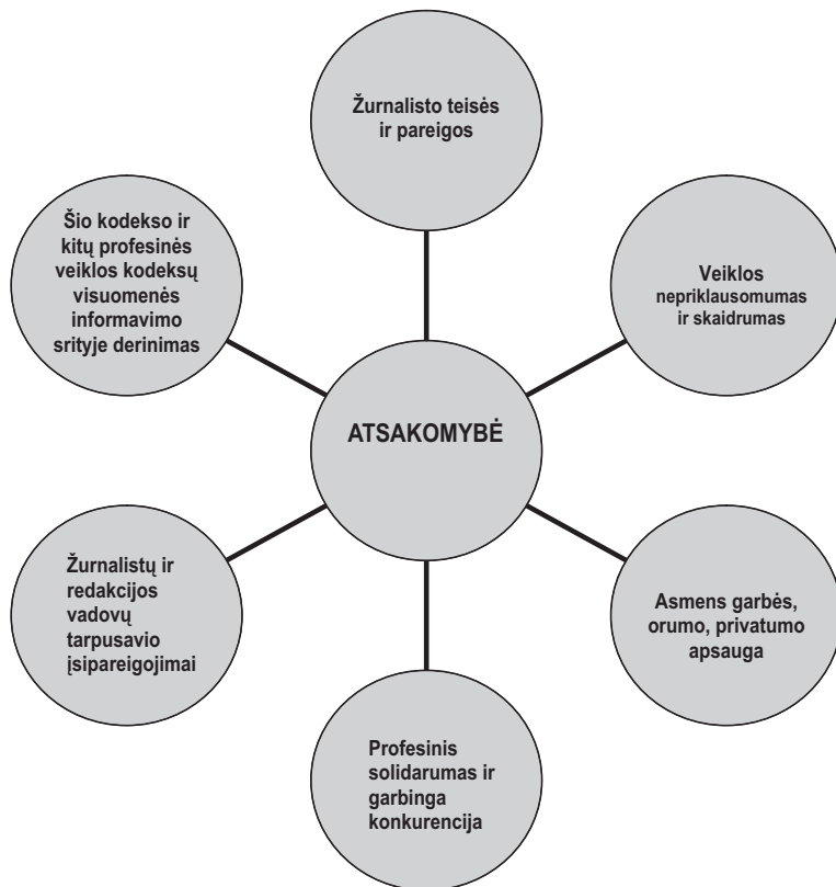
3 pav. LŽLEK struktūrinės dalys ir jų ryšiai

matome, kad visas dokumento struktūrinės dalis sieja pagrindinė – atsakomybės už žurnalistų ir leidėjų etikos kodekso pažeidimus dalis (LŽLEK 6 skyrius).