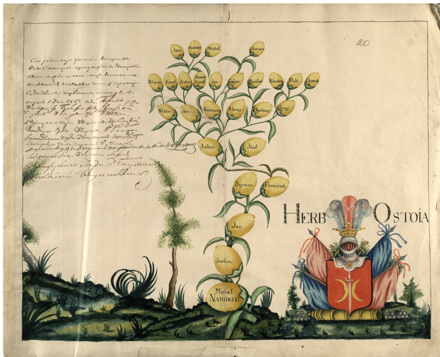
1 iliustracija. Nagurskių genealoginis medis, LVIA, F. 391, ap. 6, b. 609, lap. 20.

mą informaciją 10 . Analogą galime rasti ir XIX a. Tiškevičių genealoginiame medyje, tik čia žinias apie giminės protėvio sūnaus žmonos kunigaikštiską kilmę teikia Szymono Okolskio herbynas 11 .