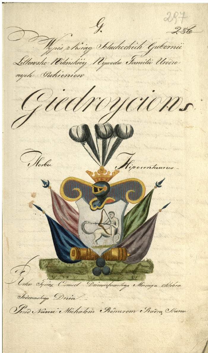
3 iliustracija. Giedraičių giminės naudotas herbas Hipocentaurus 1819 m. Giedraičių kilmingumą patvirtinančiame dokumente. LVIA, F. 708, ap. 2, b. 1, l. 297.