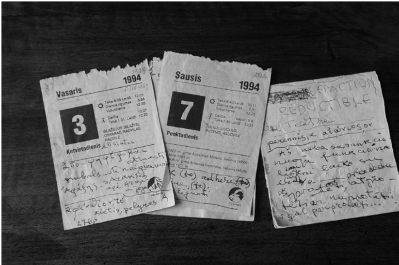
Paskutinių Juozo Miltinio (1907–1994) gyvenimo metų įrašai. PAVB JMPSC, f. JM-163.

tik atmintis, nėra dabarties, yra tik suvokimas. Apie ateitį nekalbama 9 . Čia kalbama apie tai, kad svarbiausias tikslas – atmintis ir sąmoningumas, dėl kurių išlieka reikšmingi įvykiai. Kitas įrašas toks: „Intelektas yra sugebėjimas a priori susieti vaizdinių įvairovę ir subordinuoti ją percepcijos veningumui“ 10 . Ši sentencija, kaip galima numanyti, yra paties režisieriaus filosofinių apmąstymų neseniai perskaičius tekstą išdava. Dar viename įrašė šalia prancūzų kalba užrašytų žodžių kalbama apie poelgių įvairumą ir vaizduotės ribotumą: „Mūsų vaizduotės sukurtų sprendimų skaičius niekad neprilygs beribei žmonių poelgių įvairovei“ 11 . Iš braižo galima nustatyti, kad šios mintys užrašytos dar tada, kai nestokota kūrybinės energijos,